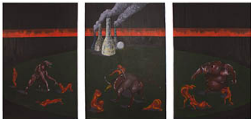
ANONYMOUS (Austria) Recinto Moderno / Modern Campus , 2012 Triptych, acrylic on wood, 108" x 72" (36" x 24" ea.)